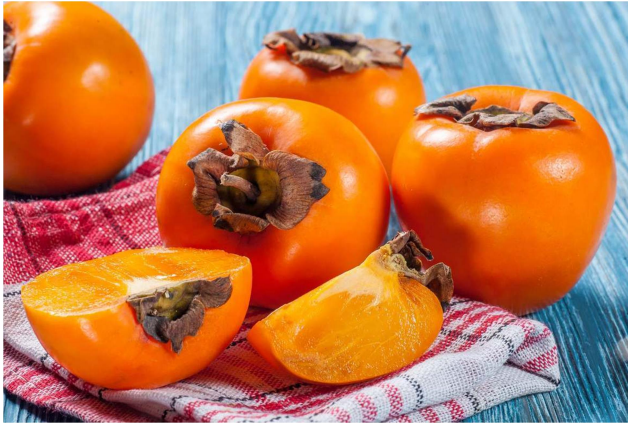
◀ (図 18) 柿は子どもたちの大好物