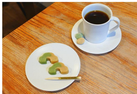
▲ (図2) 州浜