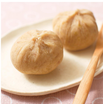
◀ (図 13) 栗きんとん

秋・栗きんとん (図 13) : 食欲の秋ともいわれる10月は秋の旬の栗とさつまいもを使った栗きんとんが登場します。炊いた栗に砂糖を加え、茶巾で絞って形を整えます。京都では似た形式の菓子を栗茶巾(くりちゃきん)とも呼びます。おせち料理に用いられる栗金団(くりきんとん)とは名前は同じですが製法が異なり、粘り気のない秋の栗きんとんとは食感も異なります。