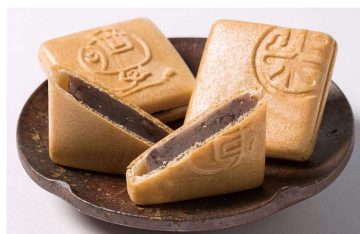
▲ (図4) モナカ