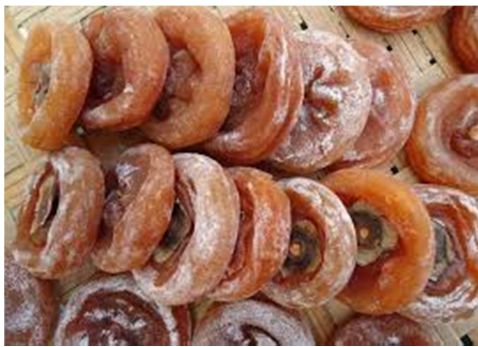
◀ (図6) 赤血球のような形をしている柿餅