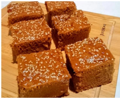
◀ (図8) 黒砂糖ケーキ、もっちりとした食感がたまらない

ではなぜ祭るときに使った供え物は澎湖の名物になったのでしょうか？澎湖での就職機会は少ないため、若者達は台湾本島へ職を探しに来ました。そのときは地元で評判の黒砂糖ケーキを周りの同僚に渡しました。時間が経ち、だんだん源利軒の黒砂糖ケーキは澎湖の名物になりました。お土産品として成立するようになったので、今では澎湖に黒砂糖ケーキの新たなブランド、例えば、春仁、媽宮など、たくさんのお店が出てきました。