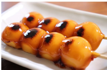
▲ (図3) みたらし団子