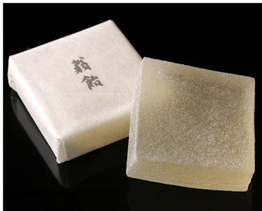
▲ (図1) 翁飴

例えばお祝いのときによくまんじゅうをプレゼントにし、春といえば桜餅など習慣があります。