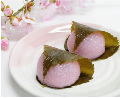
◀ (図 11) 桜餅

夏・葛切り (図 12) : ところてんのようにツルンとした葛で作られた夏の和菓子です。黒蜜ときな粉をかけてツルっと食べられるので残暑が厳しい8月に食べるのもってこいです。