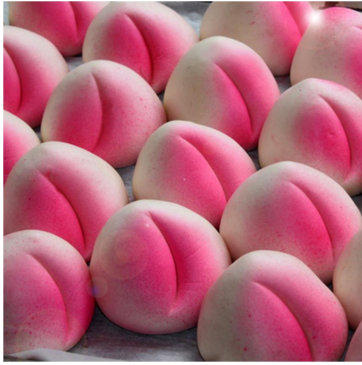
◀ (図9) ピンクの着色料で出来た桃の形をしている寿桃