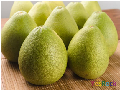
◀ (図 17) 柚子

秋・文旦（柚子） （図 17）：果実は皮の厚さが特徴で大きさの半分ほどを占めており、果実は果汁が少ないですが独特の甘みと風味を持っています。台湾ではちょうど中秋節の頃が旬なので、中秋節といえば文旦の感じがします。