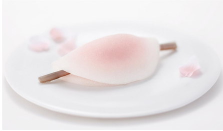
◀ (図 14) 花びら餅

染めた菱形の餅を薄く作って上に重ね、柔らかくしたふくさごぼうを二本置いて、押し鮎に見立てたものです(鮎は年魚と書き、年始に用いられ、押年魚は鮎鮎の尾頭を切っ取ったもので、古くは元旦に供えると『土佐日記』にあります)。初めはつき餅でしたが、最近は求肥となっています。白い求肥から淡い桃色が透けているの特徴も大雪の中で花が咲いているようにみえます。(部分引用：菓子の用語「花びら餅」 http://www.kanshundo.co.jp/museum/yogo/hanabira.htm )