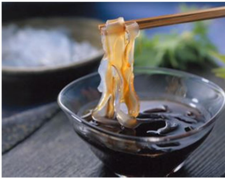
◀ (図 12) 葛切り

夏・葛切り (図 12) : ところてんのようにツルンとした葛で作られた夏の和菓子です。黒蜜ときな粉をかけてツルっと食べられるので残暑が厳しい8月に食べるのもってこいです。