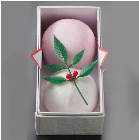
◀ (図10) 虎屋の「福福紅白饅頭」

お祝や誕生祝、喜寿、米寿など寿賀のお祝いまで、慶びに満ちた人生の節目を近親者と共に分かち合う和菓子です。和菓子の老舗・虎屋さんの製品です。江戸時代から続く謹製こしあんと薯蕷(山芋)を生地に練り込み、もちもちとした食感のある上品な味に仕上げられています。(引用: 備後福山 虎屋 https://www.tora-ya.co.jp/i/10090-01 )