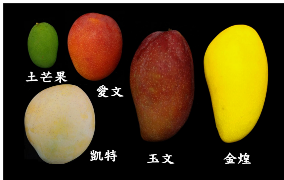
◀ (図 16) 色々なマンゴー

秋・文旦（柚子） （図 17）：果実は皮の厚さが特徴で大きさの半分ほどを占めており、果実は果汁が少ないですが独特の甘みと風味を持っています。台湾ではちょうど中秋節の頃が旬なので、中秋節といえば文旦の感じがします。