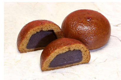
▲ (図5) まんじゅう